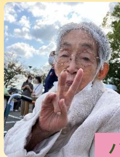
ハンドマッサージ