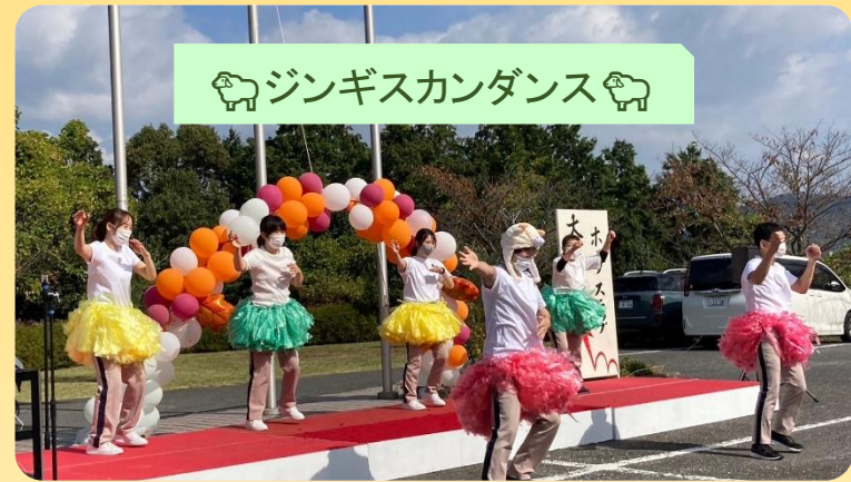
ジンギスカンダンス