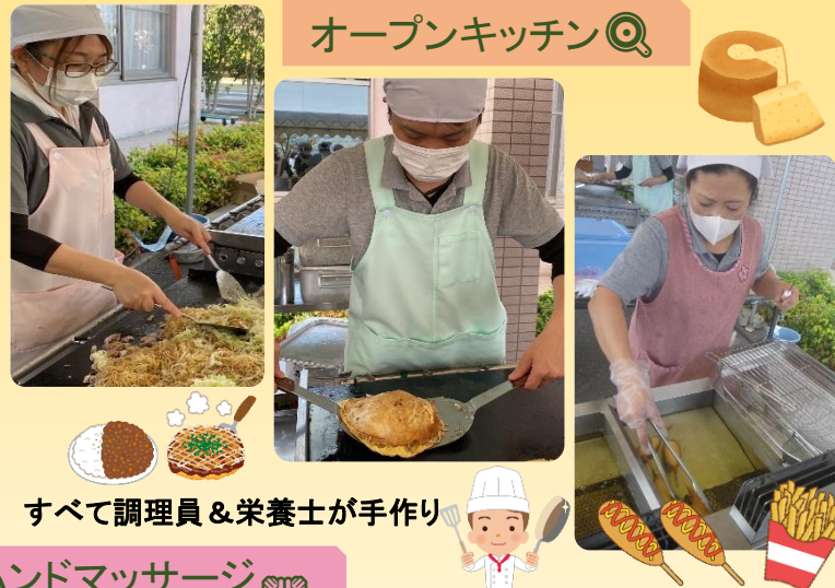
オープンキッチン