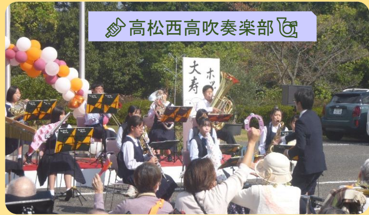
高松西高吹奏楽部