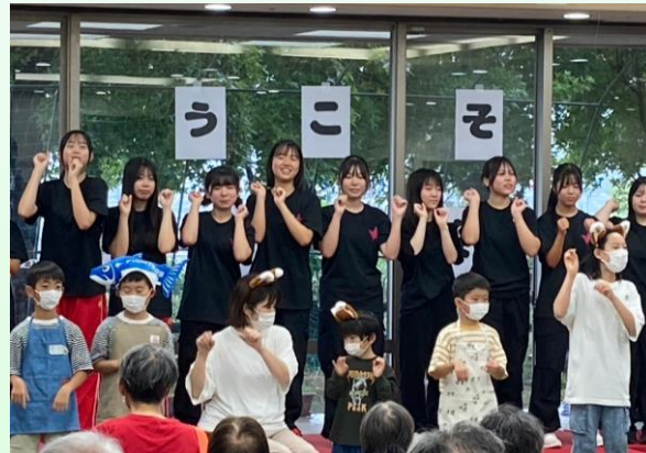
高松西高生のステージ