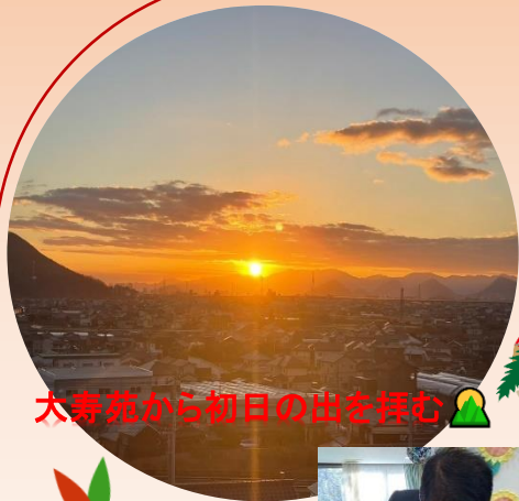
大寿苑から初日の出を拝む